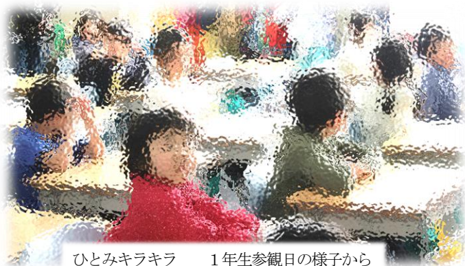
ひとみキラキラ 1年生参観日の様子から

また、「令和6年度学校経営方針」につきましても承認いただきましたが、この件につきましては、次年度始めになるかと思いますが、改めて校長としての思いを丁寧に保護者の皆様や地域の皆様にお伝えてしていきたいと考えています。