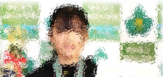
U-11冬のサッカーフェスティバル 優勝 幕別丸内FC