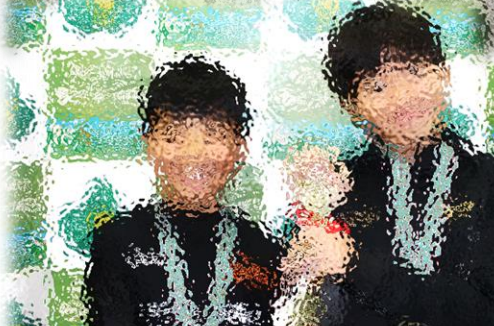
2023冬のサッカーフェスティバル 4年生クラス 優勝 帯北FC