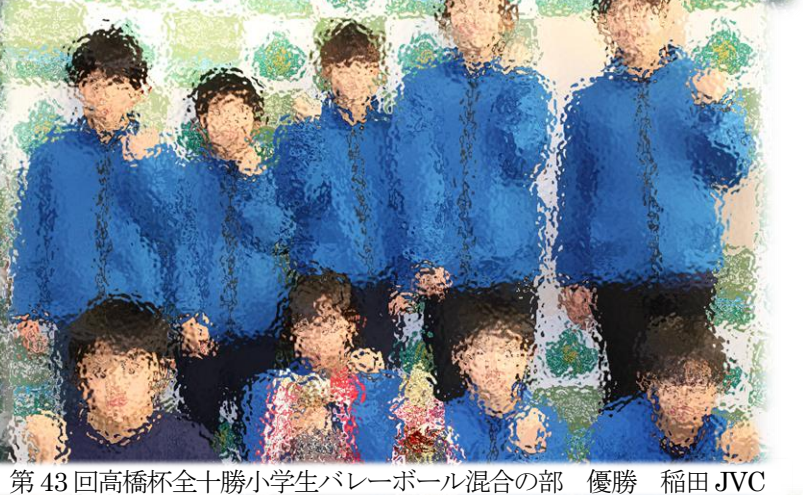
第43回高橋杯全十勝小学生バレーボール混合の部 優勝 稲田JVC