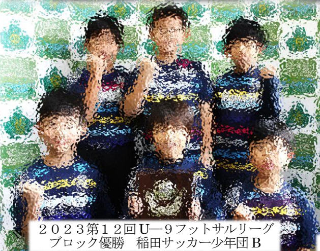
2023第12回U-9フットサルリーグ ブロック優勝 稲田サッカー少年団B