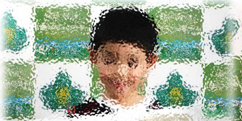
帯広市スポーツフェスティバル ラグビー3年生以下の部 優勝 帯広ラグビースクールD