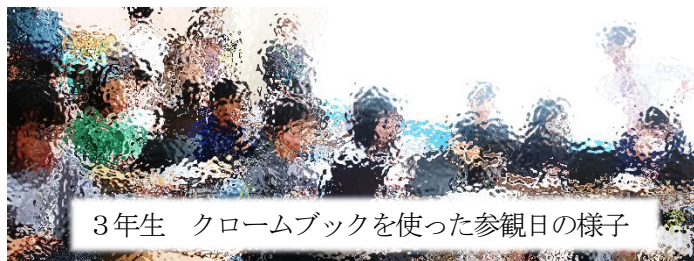
3年生 クロームブックを使った参観日の様子

今後もアフターコロナを意識しながら、皆様にお子さんの様子を見ていただく機会を多くしていこうと考えています。